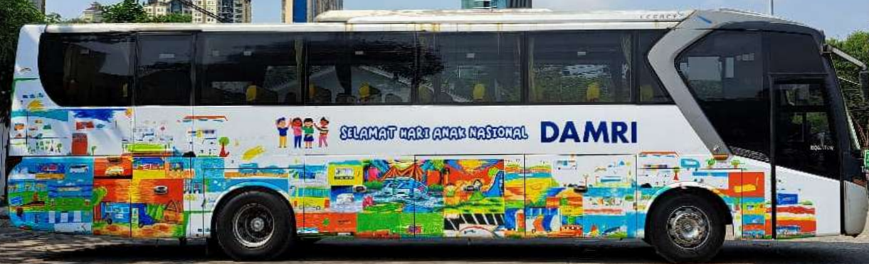
DAMRI Cabang Jabodetabek