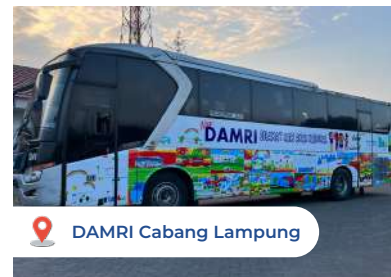
DAMRI Cabang Lampung