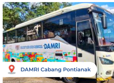
DAMRI Cabang Pontianak