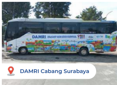
DAMRI Cabang Surabaya