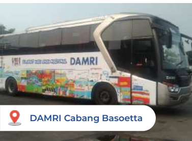
DAMRI Cabang Basoetta