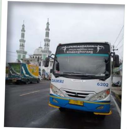
ayo naik DAMRI